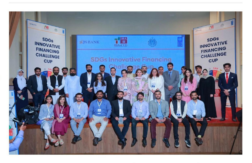
UNDP, JS Bank And IBA Join Hands To Finance Climate-Resilient SMEs